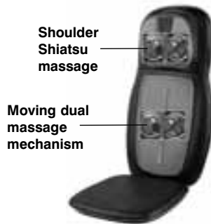
The actual product materials and fabrics may vary from the picture shown.